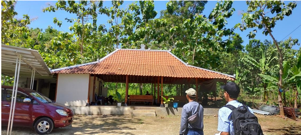
Gambar 1. Limasan sebagai ruang tamu dan koordinasi di Smart Veterinary Teaching Farm di Playen Gunung Kidul

juga telah dibangun dan berisi ayam kampung sebanyak lebih kurang 30 ekor, dan terakhir telah ditambah 5 ekor sapi Jabres juga telah menambah koleksi ternak di SVTF.