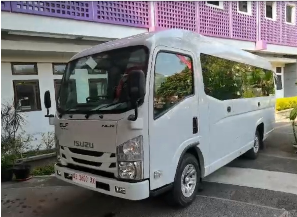
Gambar 8. Mikrobus untuk mobilitas mahasiswa dan civitas akademika