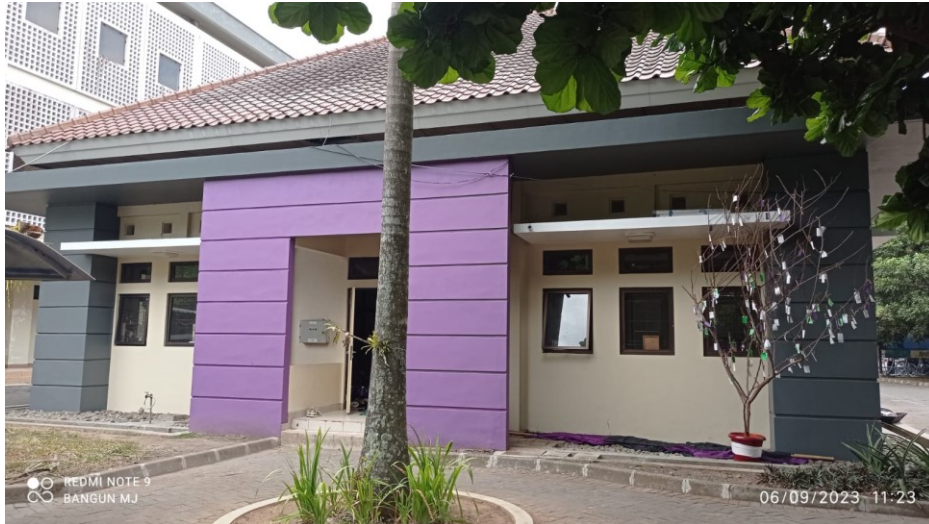
Gambar 6. Renovasi Sekretariat UKM