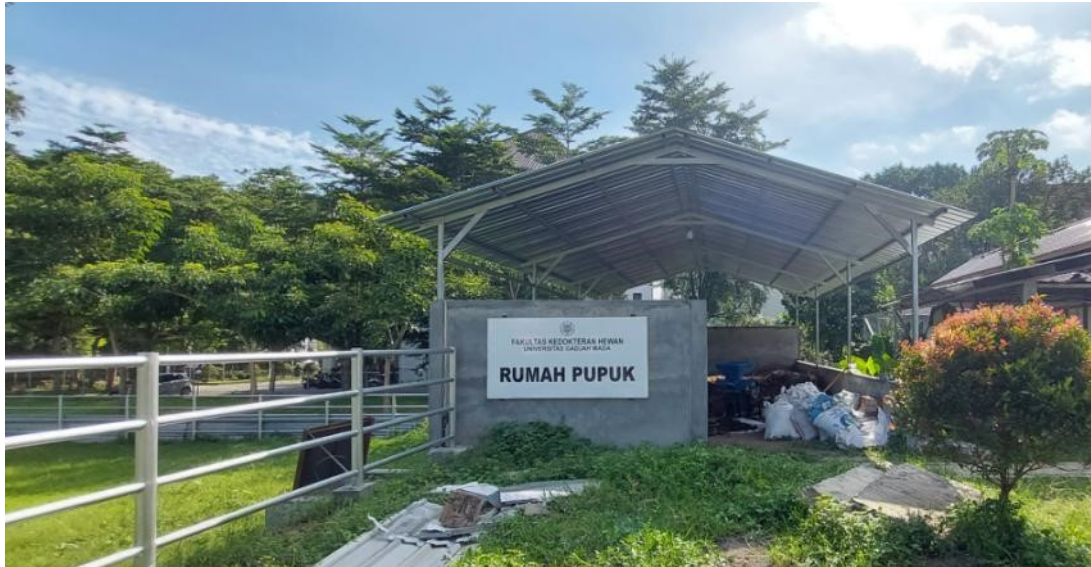
Gambar 5. Rumah Pupuk