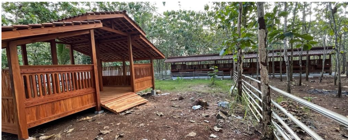
Gambar 2. Kandang Kambing di Smart Veterinary Teaching Farm di Playen Gunung Kidul