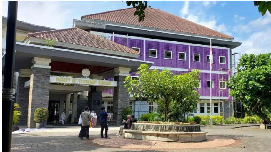
Gambar 7. Pengecatan sisi selatan gedung V3

Pada tahun 2022 telah diselenggarakan koasistensi Manajemen Rumah Sakit Hewan dan pada tahun 2023 program ini dilanjutkan dengan mengirimkan mahasiswa ke mitra di berbagai lokasi khususnya dengan Nugroho Animal Care di Semarang secara periodik. Kegiatan rutin dilakukan sehingga diperlukan kendaraan operasional yang memadai untuk mengantar dan menjemput mahasiswa ke lokasi-lokasi koas dan oleh karenanya FKH UGM telah membeli mikro bis untuk hal tersebut (Gambar 8).