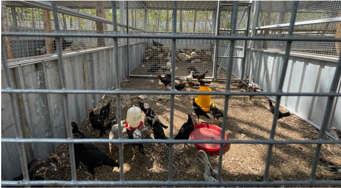
Gambar 3. Kandang ayam kampung di Smart Veterinary Teaching Farm di Playen Gunung Kidul

Sejumlah fasilitas di Unit Pendidikan dan Pelatihan Kesehatan Hewan (UP2KH) juga telah dilengkapi dengan Gazebo, kolam ikan Koi di tengah kebun rumput, rumah pupuk, perbaikan pagar sisi barat, penanaman pohon, dan penambahan koleksi ternak. Hingga Juli 2023 jenis dan jumlah hewan yang dikelola meliputi 19 ekor sapi, 5 ekor kuda, 32 ekor kambing/domba, 3 ekor kelinci, 3 monyet, dan 2 ekor kerbau, 16 ekor unggas berbagai jenis. Selain itu juga ditanam 10 pohon mangga dan 5 pohon Mojo di lingkungan UP2KH dan halaman kampus.